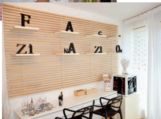
Sie sind auch handwerklich begabt und gestalten das Institut in Eigenregie regelmässig um.