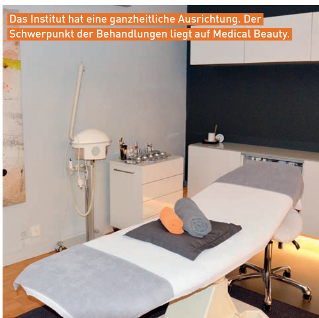
Das Institut hat eine ganzheitliche Ausrichtung. Der Schwerpunkt der Behandlungen liegt auf Medical Beauty.