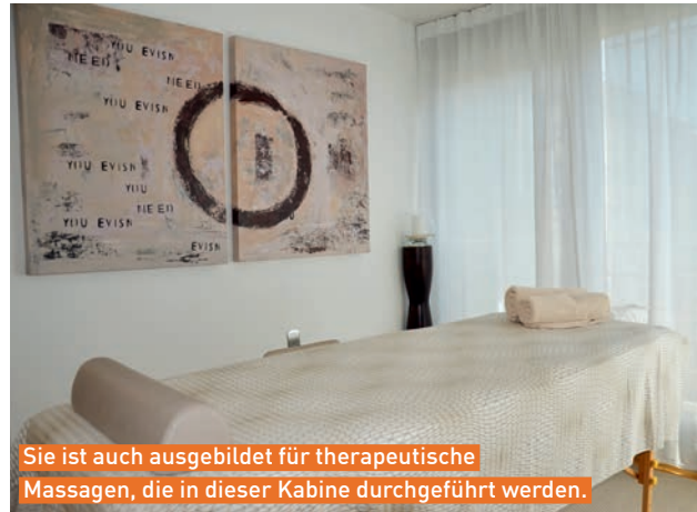
Sie ist auch ausgebildet für therapeutische Massagen, die in dieser Kabine durchgeführt werden.

N eues wagen, sich weiterbilden und kreativ tätig sein, das spielt seit jeher für die Kosmetikerin Lisa Braga Zalokar eine grosse Rolle. Die gelernte Hotel- und Tourismuskauauffrau liess ihren sicheren Job hinter sich und machte sich auf nach Wien, um eine Ausbildung zur professionellen Maskenbildnerin zu absolvieren. Zurück in der Schweiz, kam noch eine Ausbildung zur diplomierten Kosmetikerin hinzu. Im Herbst 2019 steht für Lisa Braga Zalokar ein Jubiläum an: 20 Jahre ist sie nun selbstständi-